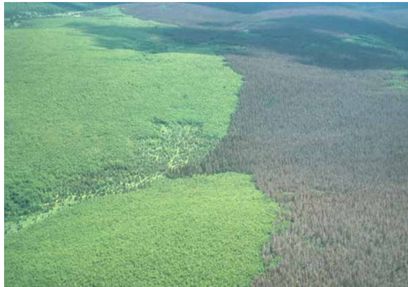
Peuplement de sapin baumier et d'épinette noire affecté (à droite) par la TBE dans le secteur de la rivière St-Jean en 1982.

C'était l'épidémiologie, comprendre comment les épidémies se développent. C'était très intéressant, car à cette époque il y avait un monopole des connaissances au gouvernement fédéral entre le laboratoire de Fredericton et celui de Québec. L'autre élément important, c'est qu'il existait une « bible » de la tordeuse des bourgeons de l'épinette (TBE), elle disait de façon très claire que les épidémies de tordeuses commençaient au nord de la forêt boréale après trois ou quatre ans de printemps chauds et secs. Sauf que lorsque j'étais professeur et que le gouvernement du Québec m'a demandé de l'aider à mieux comprendre ce phénomène, ce que j'ai vu ne correspondait pas du tout à ce que disait « la bible », alors cela m'a intrigué. Ma première assignation avec le gouvernement c'était dans le Témiscouata dans des érablières, ensuite ils m'ont envoyé en Gaspésie, puis à La Macaza, j'observais toujours la même chose, alors que l'on n'était pas en forêt boréale. J'ai donc commencé à développer ma recherche autour de ça. Et pour cela, j'ai pu compter sur des étudiants dédiés. Je crois que j'arrivais assez bien à transmettre ma passion en tant que professeur et il y a plusieurs étudiants qui ont fait leur maîtrise ou leur doctorat avec moi.