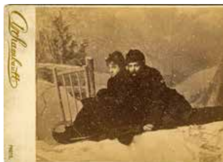
Honoré Beaugrand et son épouse d'origine américaine, Eliza Walker.