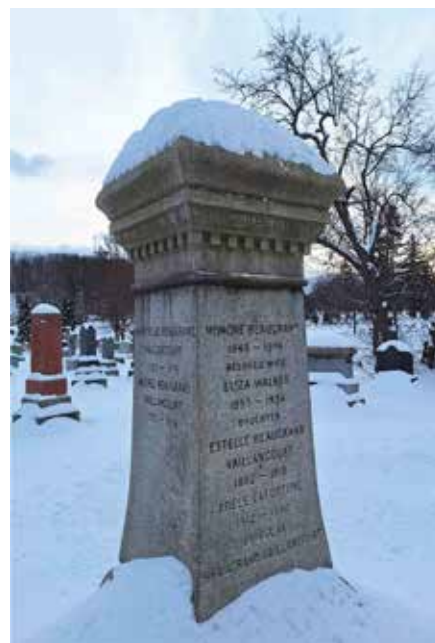
Honoré Beaugrand est inhumé au Cimetière Mont-Royal. Sa pierre tombale, située sur son lot familial (F1520), mentionne son nom, les noms de son épouse et de quelques descendants.

Cimetière Mont-Royal: « Honoré Beaugrand a été une des premières personnes incinérées au Canada. [...] Nous organisons chaque année plusieurs activités pour mettre en valeur l'histoire du Cimetière [...] et nos visites historiques guidées et nos dépliants mentionnent Honoré Beaugrand parce qu'il suscite beaucoup d'intérêt auprès de nos visiteurs. Ce grand intellectuel mérite qu'on s'y attarde car plusieurs aspects de sa vie permettent de comprendre des éléments historiques importants comme son embauche dans différentes armées, son séjour en Nouvelle-Angleterre dans les communautés francophones et ses idées libérales défendues avec panache dans ses écrits. »