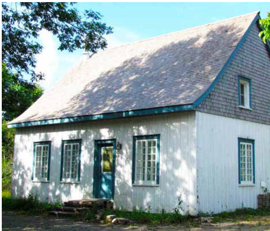
La Maison Honoré-Beaugrand est située à Lanoraie.

Honoré Beaugrand est né le 24 mars 1848 à Lanoraie. Il est le fils de Louis Beaugrand dit Champagne, navigateur, et de Marie-Josephte (Joséphine) Marion. Après des études au Collège Joliette et au Noviciat des Clercs de Saint-Viateur, il entreprend de faire un entraînement militaire à l'École militaire de Montréal.