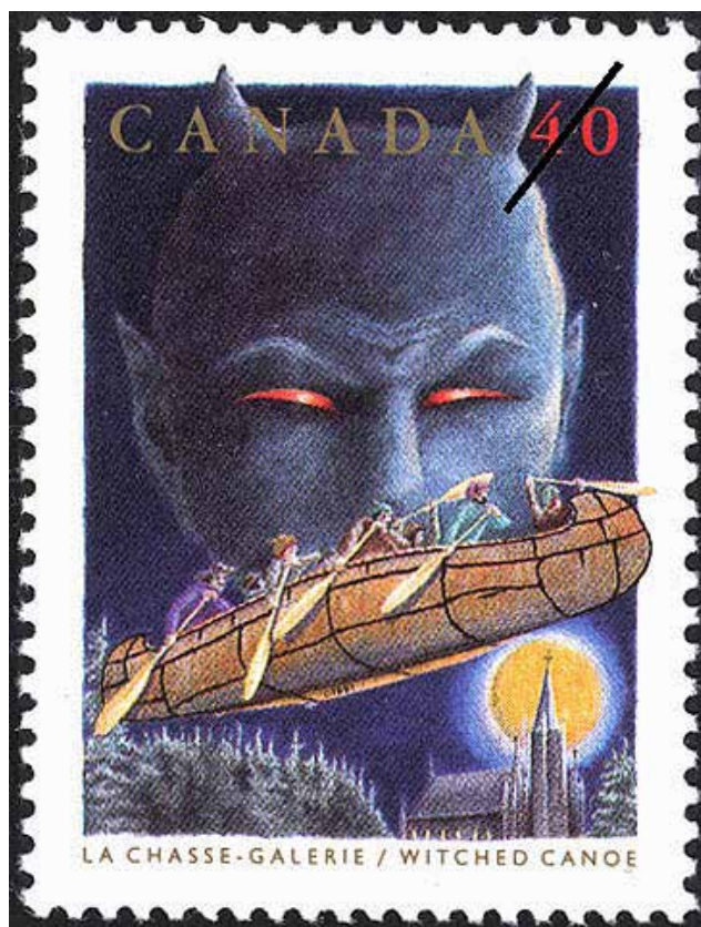
Timbre de la Société canadienne des postes, de 40 ¢, à l'effigie de la chasse-galerie et mis en circulation en 1991.

Warren, Jean-Philippe (2015), Honoré Beaugrand: la plume et l'épée (1848-1906) , Montréal, Boréal, 532 p.