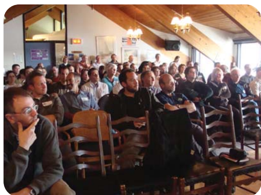
Auditoire lors de la conférence donnée à la DIF