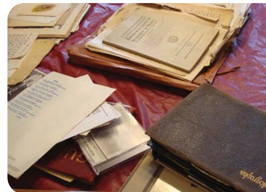
Archives de la famille Piché

La SHFQ a rencontré la famille Piché à la suite d'une demande officielle faite par le doyen de la Faculté de foresterie, le président de l'OIFQ et le président de la SHFQ. Plusieurs documents d'archives intéressants ont été découverts, dont des rapports annuels, de la correspondance et des photographies. La famille a accepté que la SHFQ procède à la numérisation des documents.