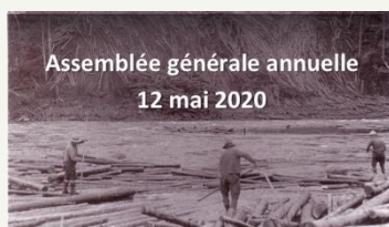
Assemblée générale annuelle 12 mai 2020